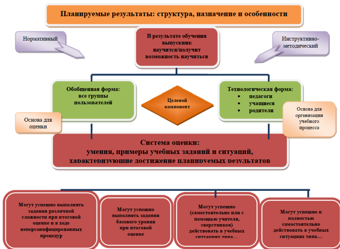
Рис1. Особенности структуры планируемых результатов. Функция и назначение

Основными направлениями и целями оценочной деятельности в МБОУ СШ №5 им.С.М. Кирова соответствии с требованиями ФГОС ООО являются: